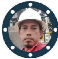
Arman AB KCT 1902