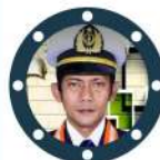
Mulyawan syahid Big Marine

Karakter tidak dapat dikembangkan dalam kemudahan dan ketenangan. Hanya melalui pengalaman pencobaan dan penderitaan, jiwa dapat diperkuat, visi menjadi jelas, ambisi terinspirasi, dan kesuksesan dicapai