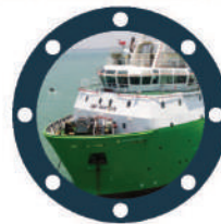
PSV ANGGREK 7501