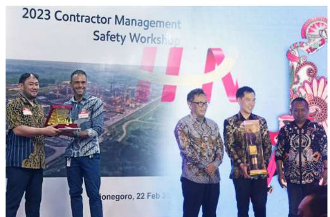
Penghargaan Program K3 & Tokoh Pengusaha Daerah 2023