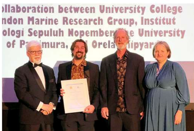
The 2023 Maritime Safety Award Is Presented to Orela Shipyard